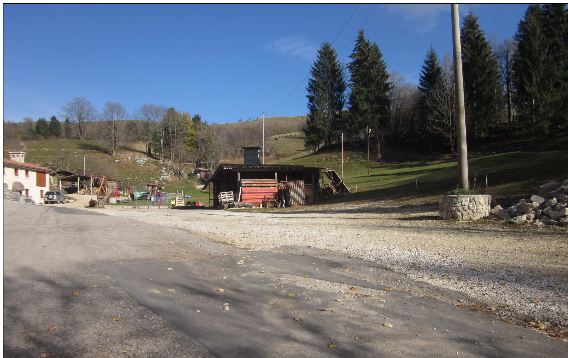
Punto 2: Vista dell'area sterrata