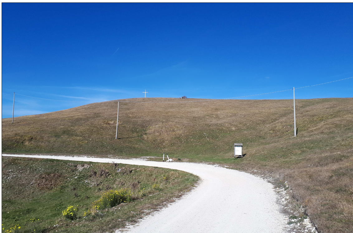
Punto 7: spiazzo lungo Via Col Fenilon verso Col Moschin