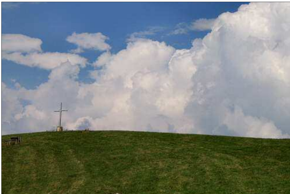
Punto 8: Area adiacente la croce del Col Fenilon.