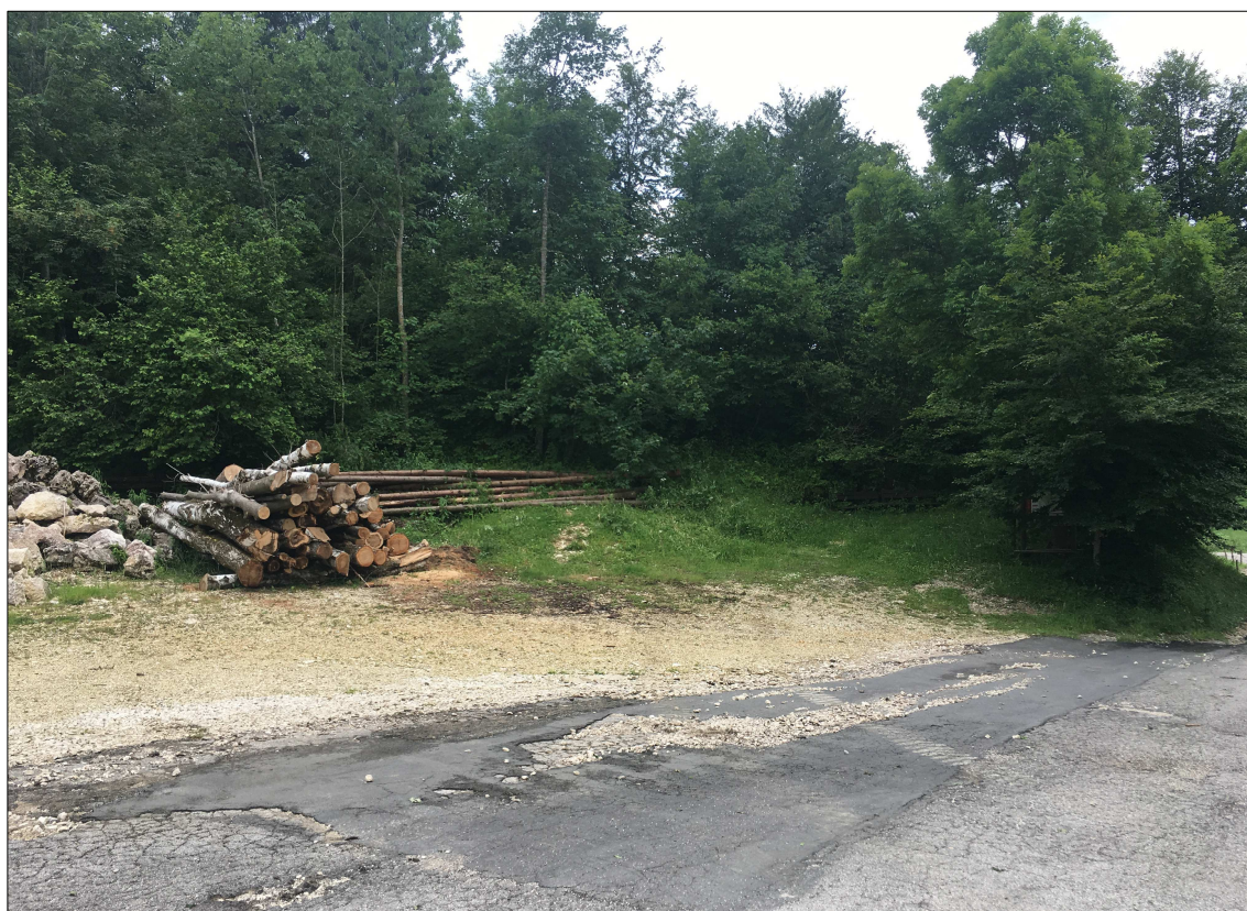
Punto 3: Vista dell'angolo dedicato dal progetto alla definizione di un'area sosta e pannelli